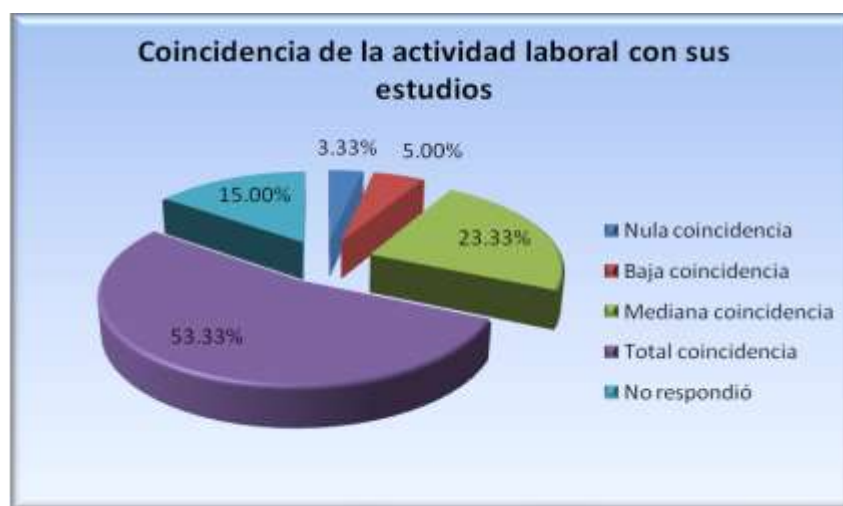
Figura 5.6.3 Coincidencia de su actividad laboral con los estudios

La coincidencia de las actividades en el empleo actual con sus estudios es total para el 53.33%, mediana para el 23.33%, nula para el 3.33%, baja para el 5% y el 15% no respondió (figura 5.6.3).