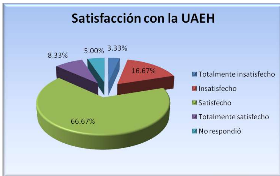
Figura 5.10.1 Satisfacción con la institución

La figura 5.10.1 muestra que el 66.67% de los egresados encuestados quedó satisfecho con la UAEH, el 8.33% quedó totalmente satisfecho, el 16.67% quedó insatisfecho, el 3.33% quedó totalmente insatisfecho y el 5% no respondió