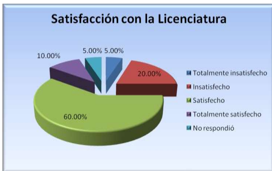
Figura 5.10.2 Satisfacción con la licenciatura

La figura 5.10.2 muestra que el 60% de los egresados encuestados estuvo satisfecho con la Licenciatura en Derecho de la Escuela Superior de Huejutla, el 10% quedó totalmente satisfecho, el 20% quedó insatisfecho, el 5% quedó totalmente insatisfecho y el 5% no respondió.