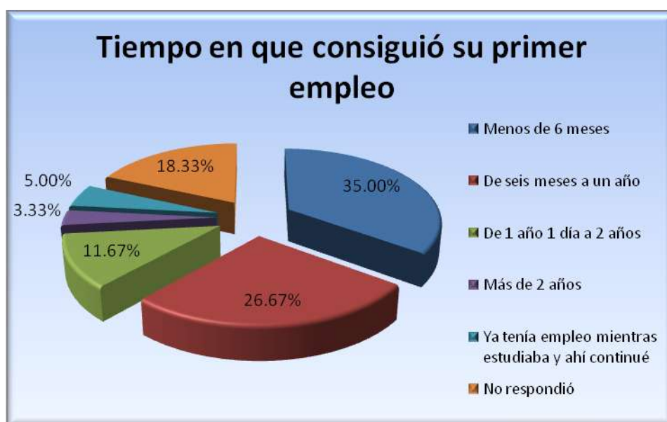
Figura 5.6.2 Tiempo en conseguir el primer empleo

De la proporción de egresados que consiguió empleo, el 35% lo halló en menos de 6 meses, el 26.67% entre 6 meses y un año, el 11.67% entre 1 año un día a 2 años, el 3.33% más de 2 años y el 18.33% no respondió, lo cual se muestra en la figura 5.6.2.