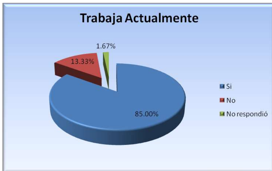
Figura 5.6.1 Trabaja actualmente

El 85% cuenta con trabajo actualmente, el 13.33% no trabaja y el 1.67% no respondió (figura 5.6.1).