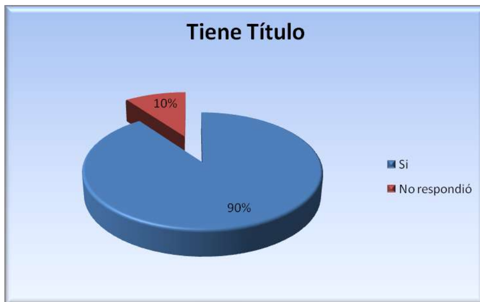
Figura 5.3.1 Título

Como se aprecia en la figura 5.3.1, respecto al índice de titulación de los egresados, el 90% ya cuenta con título, mientras que el 10% no.